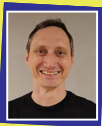
Oberst Arbuthnot / Samuel Ratchett Michael Ott