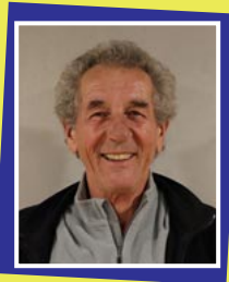
Hercule Poirot Josef Hutzler